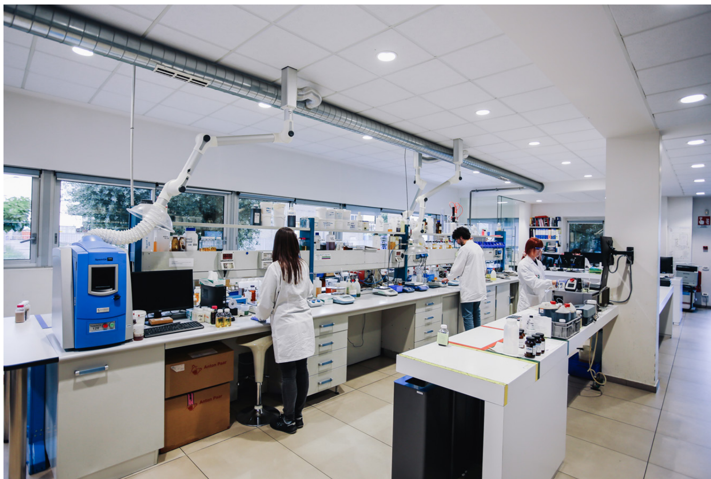
Il laboratorio R&D di Bellini Spa

Proprio questa diversificata produzione, destinata a settori sempre più esigenti, ha spinto l'azienda a ricercare soluzioni innovative per ottimizzare i processi produttivi, elevare la propria competitività, con particolare attenzione alle fasi di fresatura e filettatura. In questo percorso di ottimizzazione, Da-Tor ha scelto di focalizzarsi su un elemento spesso sottovalutato: il lubrorefrigerante. La collaborazione con Bellini, specialista in tecnologie di lubrificazione, ha portato all'adozione di prodotti innovativi a base di esteri vegetali biodegradabili che hanno svolto un ruolo operativo decisivo per l'efficienza complessiva di processo, ottenendo risultati molto interessanti.