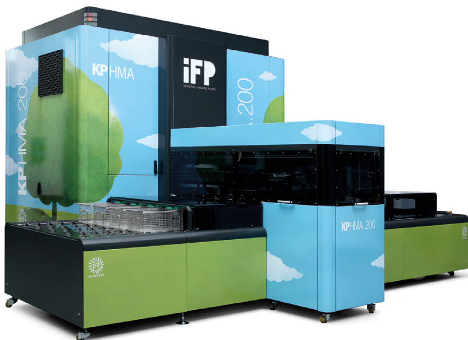
KP 200 Max Decor di IFP Europe

ne dei semilavorati, per oltre 5.000 mq totali di superficie operativa.