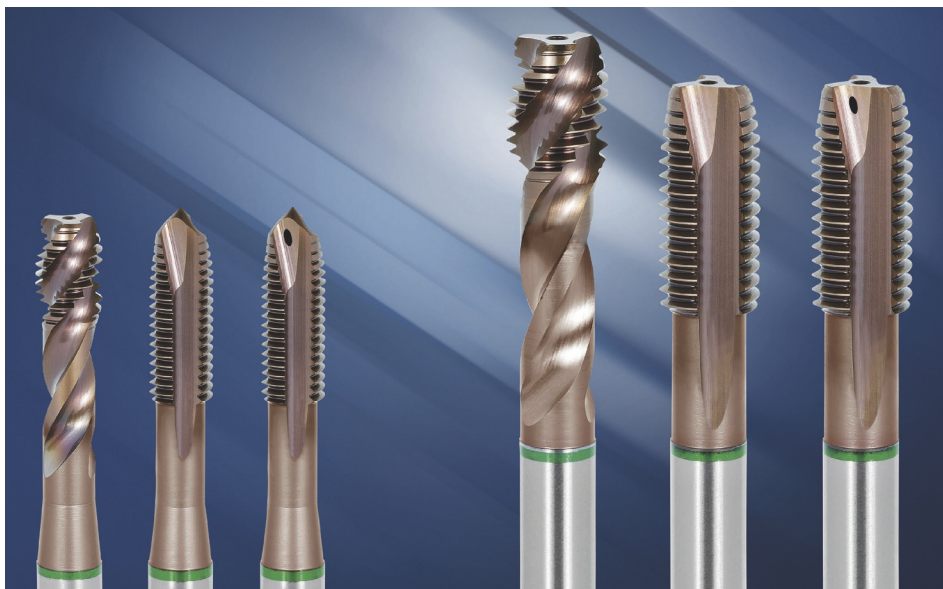
Il nuovo maschio Garant MasterTap di Hoffman Group sarà disponibile per un ampio campo di materiali ed è previsto in 13 forme, tolleranze e norme differenti.

stre aspettative. Anche su leghe duttili, come quelle in rame, si ottengono filetti estremamente precisi senza taglio assiale. Ciò dipende soprattutto dalla progettazione ben studiata del filetto guida. Inoltre, per la lavorazione su materiali molto duri, abbiamo arrotondato gli angoli di taglio. Grazie al materiale molto resistente Hss-E-PM in combinazione con il rivestimento speciale ALTIX, estremamente liscio e ad alte prestazioni, è possibile lavorare anche leghe in alluminio a elevate velocità di taglio».