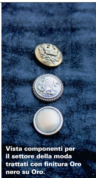
Vista componenti per il settore della moda trattati con finitura Oro nero su Oro.