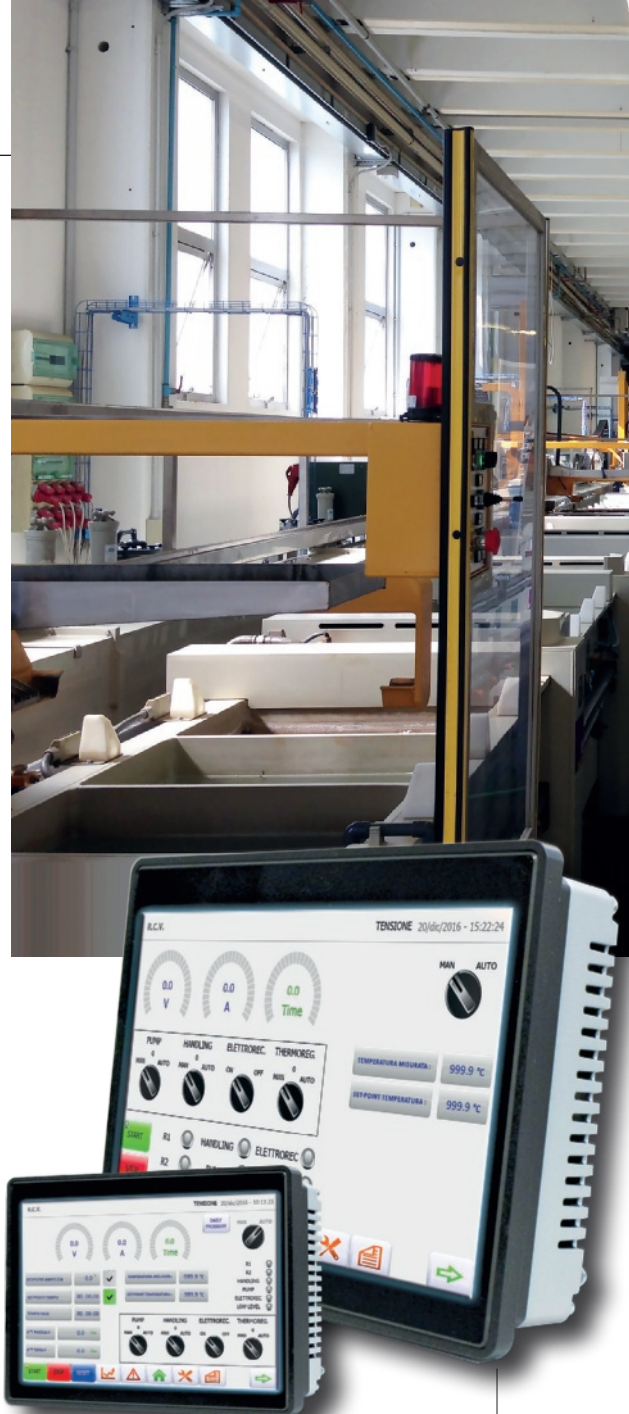
I Panel Touch RCV sono i nuovi pannelli sviluppati da R.C.V. per il controllo completo dei raddrizzatori.

«Nella sede di Altavilla Vicentina – aggiunge e conclude Rizzi – abbiamo creato e sistemato nuovi reparti per rendere l'edificio esteticamente più moderno, più efficiente dal punto di vista del risparmio energetico e ampliato la superficie produttiva di 600 mq disponendo ora di 1400 mq totali in linea con la nostra filosofia di guardare sempre al futuro. Crediamo nel futuro con la sicurezza di un passato iniziato nel 1964».