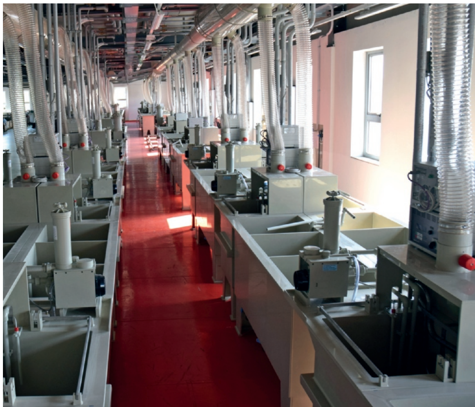
Vista del nuovo impianto a telaio statico in Bedin Galvanica, dove sono stati integrati i nuovi raddrizzatori R.C.V. LineTech.